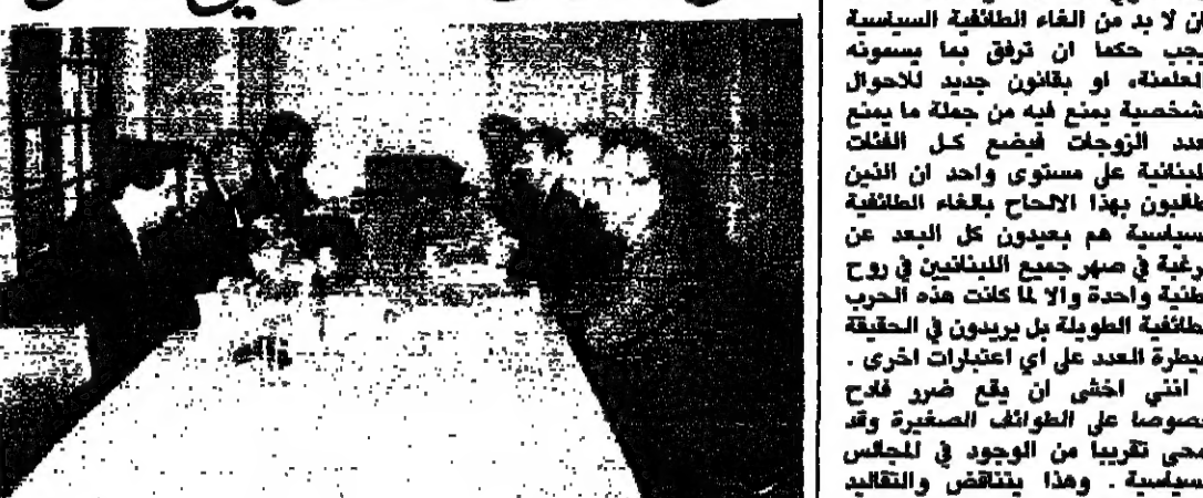
اللقاء المشترك بين اللقاء الاسلامي والموارنة لشمعون (محمود الطويل)

عقد اللقاء الاسلامي وتجمع النواب الموارنة المستقلين لاجتماعهما المشترك الثاني امس اثر لقائهما الاول يوم الثلاثاء من الاسبوع الماضي. وقررا البدء بعمل مشترك ومستمر وعقد لقاءات اسبوعية في امل ان يتحول تنازعا الى تحالف وطني شامل يكون الدرع الواقية القادرة على الاتفاق في وجه الاخطار الداهية والمخلة.